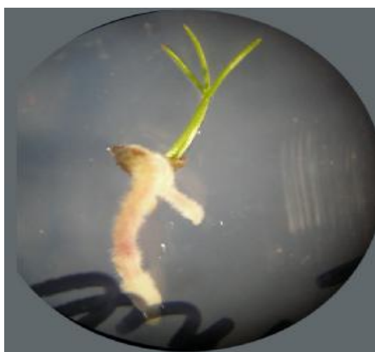
شکل 4: نوساقه ریشه‌دار شده توده فارس در محیط \frac{1}{2} MS

Figure 3: Regenerated shoots from Khorasan accession callus in Gamborg's medium complemented with 0.2 mg/l NAA+0.1 mg/l BAP+0.4 mg/l IAA