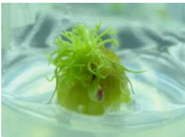
شکل 3: نوساقه‌های تولید شده از پینه توده خراسان در

باشند. محیط کشت ریشه‌زایی ( \frac{1}{2} MS) حاوی 0/2 میلی- گرم در لیتر IAA بود که در آن همه نوساقه‌ها ریشه‌دار شدند (شکل 4). در این آزمایش 90 درصد گیاهچه‌های باززایی شده زنده ماندند و گیاهچه‌ها 20 تا 30 روز پس از انتقال به محیط خاکی تولید گل نمودند (شکل 5). در این آزمایش گیاهچه فاقد کلروفیل (Albino) مشاهده نشد.