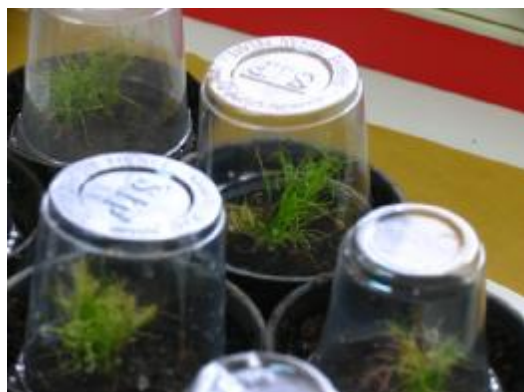
شکل 1: گیاهچه‌های باززایی شده توده خراسان و انتقال آن‌ها به خاک در شرایط گلخانه

محیط کشت گامبورگ 5 محتوی 30 گرم در لیتر ساکارز استفاده شد و به منظور ایجاد تیمارهای هورمونی متفاوت از IAA به میزان 0/2 و 0/4 میلی گرم در لیتر، NAA به میزان 0/2، 0/4 و 0/6 میلی گرم در لیتر و BAP به میزان صفر و 0/1 میلی گرم در لیتر استفاده گردید. بر این اساس، آزمایش به صورت فاکتوریل در قالب طرح کاملا تصادفی با هشت تکرار (پتری دیش) اجرا شد و هر پتری دیش حاوی پنج ریز نمونه بود. فاکتورهای آزمایشی شامل سه توده زیره، دو غلظت IAA، سه غلظت NAA و دو غلظت BAP به شرح فوق بودند. pH محیط روی 5/7 تنظیم و از آگار به میزان هفت گرم در لیتر، به عنوان جامد کننده استفاده شد. محیط کشت تهیه شده به مدت 20 دقیقه در فشار 1/5 اتمسفر و دمای 121 درجه سانتی گراد اتوکلاو شد. ریزنمونه‌ها (جنین‌های برش یافته)، به صورت افقی روی محیط کشت درون پتری-دیش‌ها کشت شدند و شیشه‌ها درون اتافک رشد، با فتوپریود 16 ساعت روشنایی، شدت نور 6500 لوکس و دمای 25 درجه سانتی گراد نگهداری شدند. برای ارزیابی میزان پینه‌زایی ریزنمونه‌ها، درصد نمونه‌های رشد یافته ملاک عمل قرار گرفت. گیاهچه‌های باززائی شده حاوی ریشه و ساقه از محیط کشت خارج شده و پس از شستشوی ریشه‌ها با آب، به گلدان‌های حاوی خاک شنی و خاک برگ استریل به نسبت 1:1 منتقل و سپس به گلخانه انتقال داده شدند. جهت جلوگیری از اتلاف رطوبت، روی گلدان‌ها با سرپوش پلاستیکی پوشیده شد (شکل 1). گلدان‌ها هر روز آبیاری شدند و به مرور زمان با ایجاد سوراخ‌هایی در این سرپوش‌ها، گیاهان به شرایط محیطی عادت داده شدند.