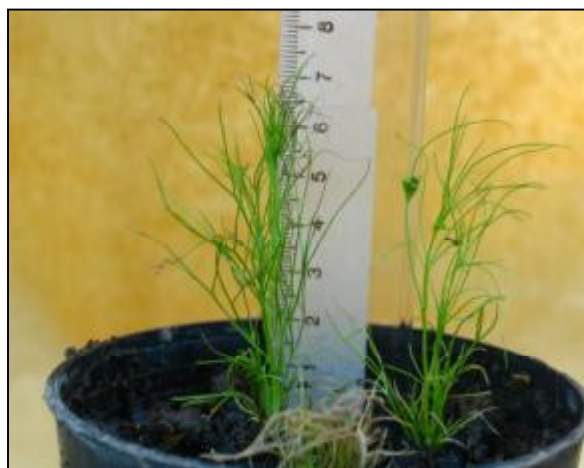
شکل 5: گیاهچه‌های سازگار شده در گلخانه و آغاز گلدهی پس از 30 روز از انتقال به خاک در توده کرمان

ns, * and **: non-significant and significant at 5 and 1% levels, respectively.