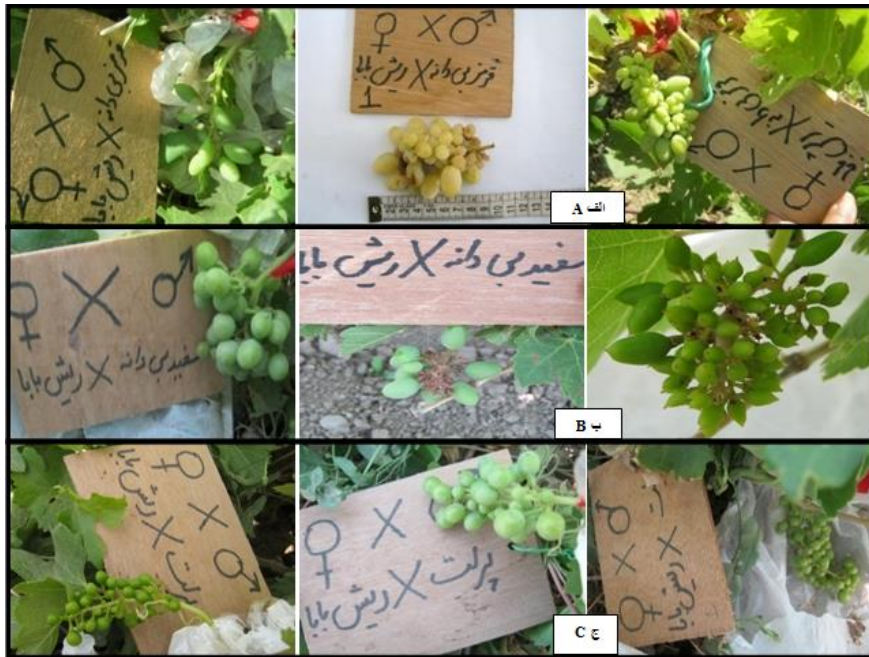
شکل ۳: نمونه‌هایی از نسل F 1 حاصل از دورگه‌رگیری رقم ریش بابا سفید با دانه گرده ارقام مختلف. الف) تلاقی رقم ریش بابا سفید با دانه گرده رقم بیدانه قرمز. ب) تلاقی رقم ریش بابا سفید با دانه گرده رقم بیدانه سفید. ج) تلاقی رقم ریش بابا سفید با دانه گرده رقم پرلت