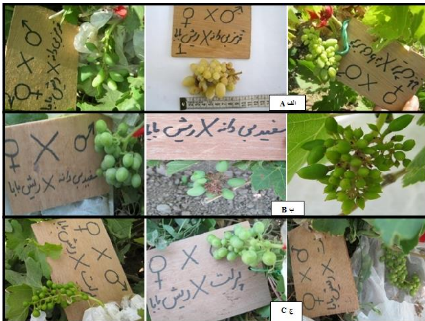
شکل ۳: نمونه‌هایی از نسل F 1 حاصل از دورگه‌رگیری رقم ریش بابا سفید با دانه‌گرده ارقام مختلف. الف) تلاقی رقم ریش بابا سفید با دانه‌گرده رقم بی‌دانه قرمز. ب) تلاقی رقم ریش بابا سفید با دانه‌گرده رقم بی‌دانه سفید. ج) تلاقی رقم ریش بابا سفید با دانه‌گرده رقم پرلت